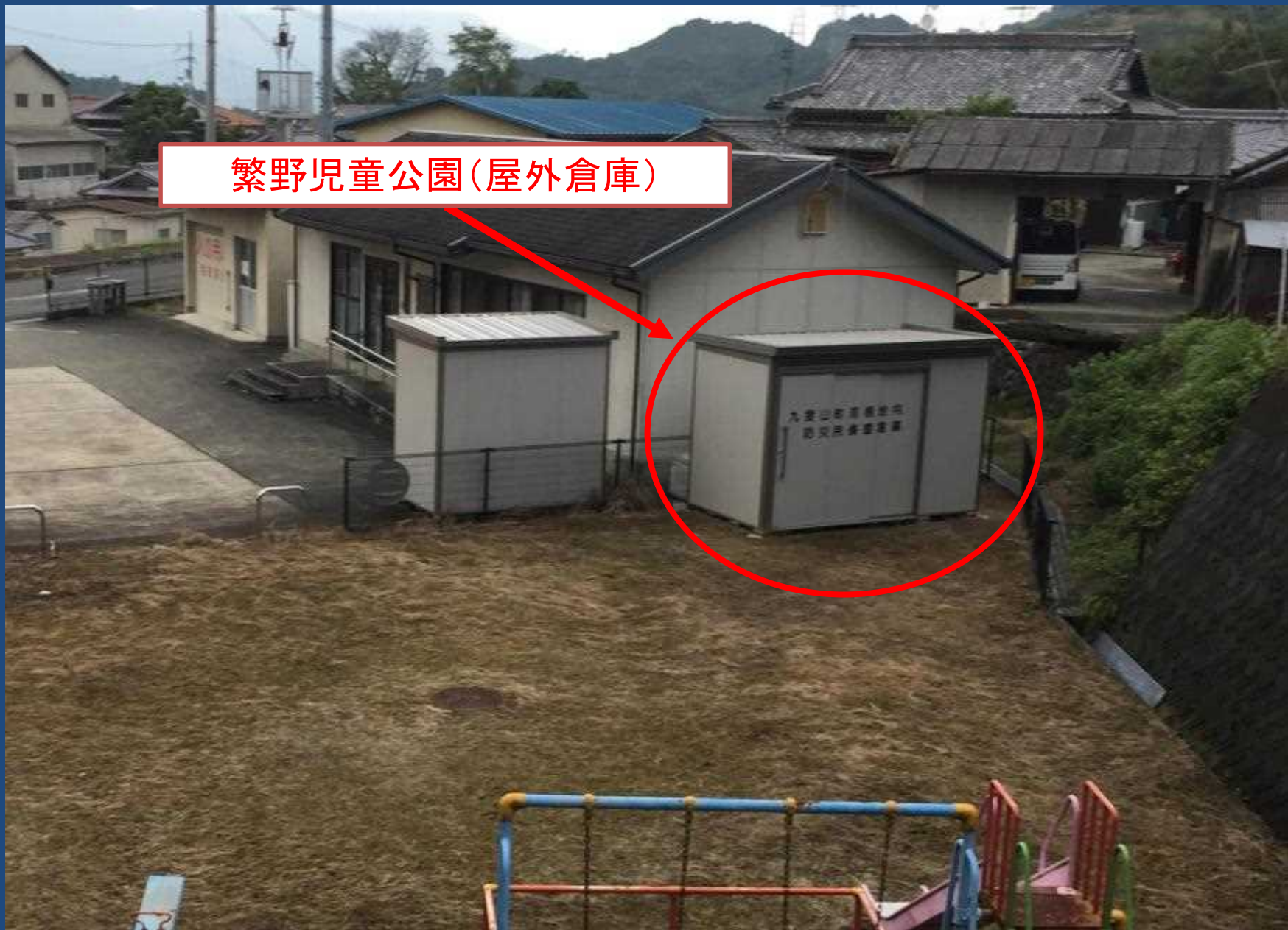
繁野兒童公園(屋外倉庫)